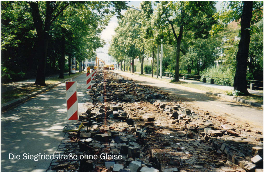
Die Siegfriedstraße ohne Gleise

Zu Beginn wurde die Siegfriedstraße zwischen Hamburger Straße und Nibelungenplatz (1. Bauabschnitt) für den KfZ- und für den Stadtbahn-Verkehr bis voraussichtlich Dezember 2003 gesperrt. Es werden nun die alten Gleiskörper, die Fahrleitung und die Fahrbahn erneuert. In diesem Zusammenhang wird die Haltestelle Nibelungenplatz niederflurgerecht umgebaut, so daß später alle Fahrgäste bequem ein- oder aussteigen können.