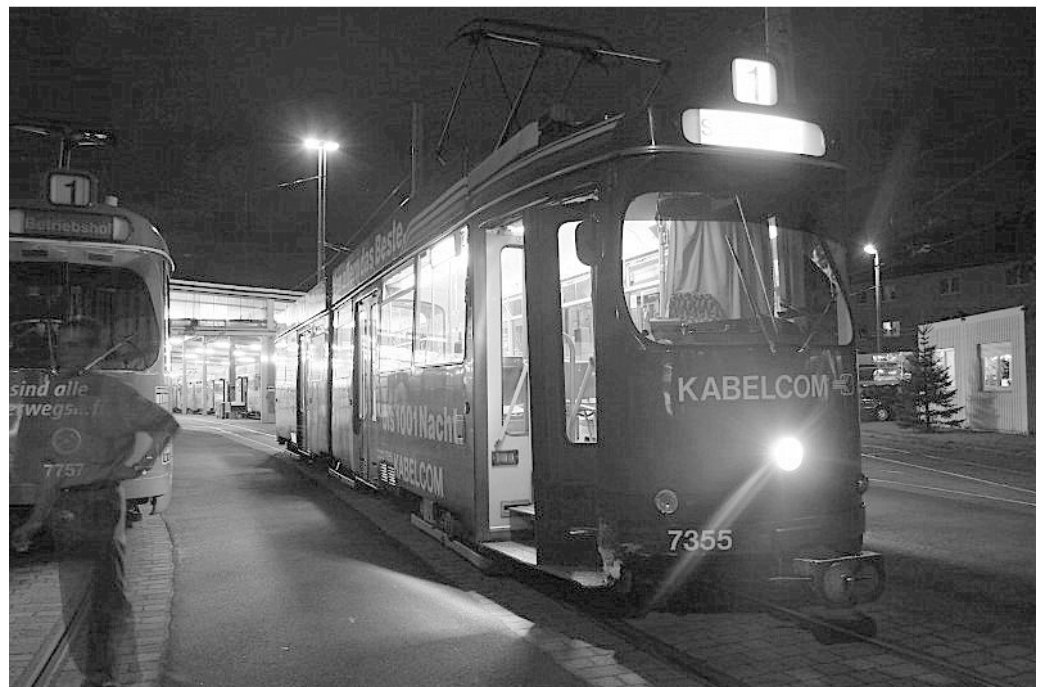
...erlitt 7355 in seinen letzten Einsatztagen einen leichten Blech- schaden bei einem Unfall...