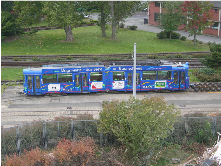
7351 auf dem Bth. Hasenwinkel