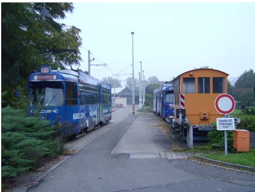
...was auch diesem Wagen die Abstellung im Hasenwinkel bescherte.