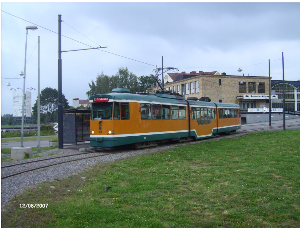
Tw 63 in der erst vor kurzem eröffneten provisorischen Wendeschleife Ljura.

Zwischenzeitliche Versuch mit mehr Linien, zwei Stamm- und zwei HVZ-Linien, Ende der 90er Jahre hielten nicht lange vor und wurden wieder fallen gelassen.