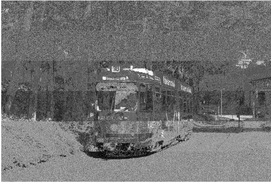
Noch im Mai auf der Messelinie 10 im Einsatz...